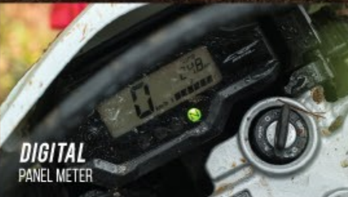
DIGITAL PANEL METER