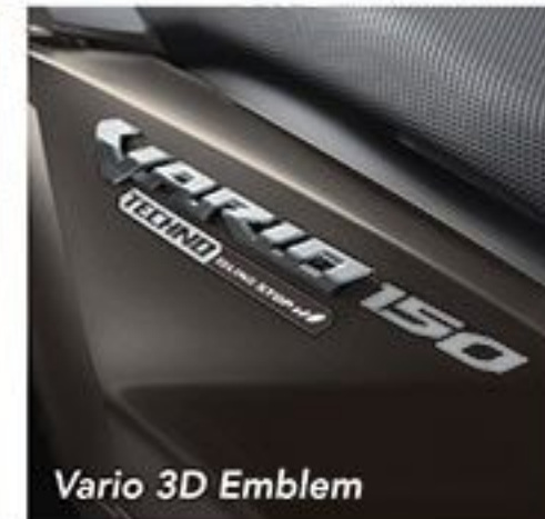
Vario 3D Emblem