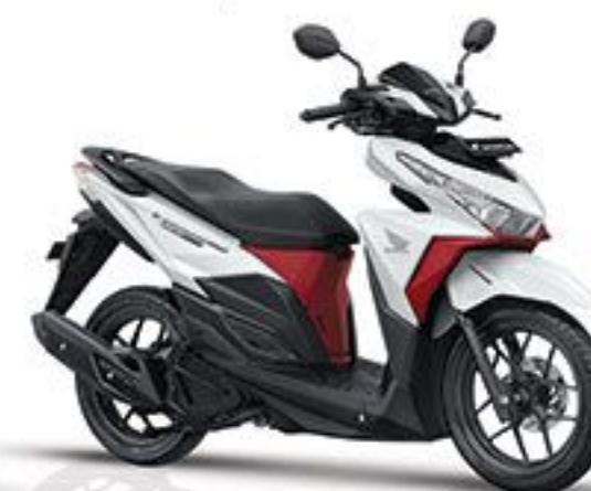
Exclusive Pearl White