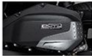
Air Cleaner Garnish Lebih mewah dengan aksen garnish.