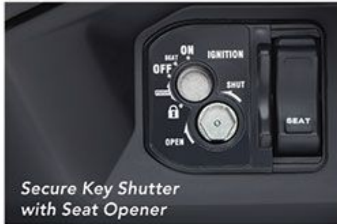
Secure Key Shutter with Seat Opener