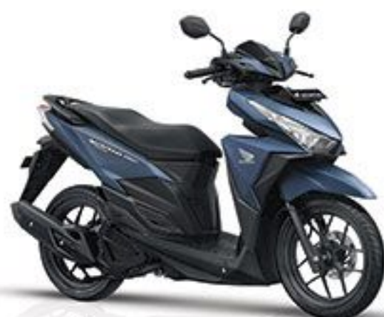
Exclusive Matte Blue