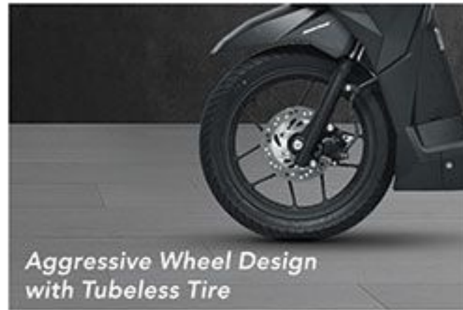
Aggressive Wheel Design with Tubeless Tire

Semakin eksklusif dengan kehadiran fitur-fitur terbaik Honda yang melengkapi sensasi kesempurnaan berkendara sesungguhnya.