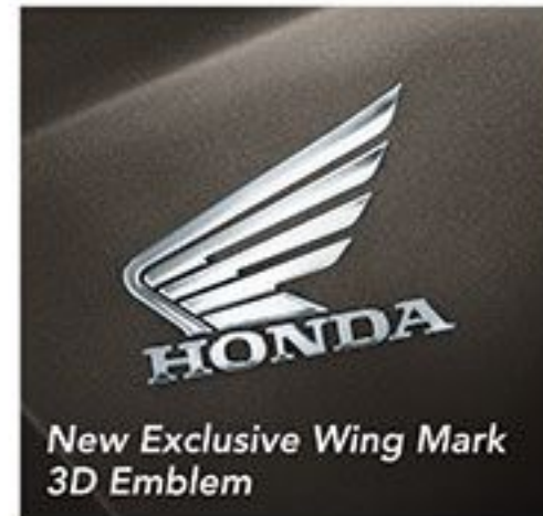
New Exclusive Wing Mark 3D Emblem

Dirancang sempurna dengan garis agresif dan desain elegan yang kini tampil makin premium dengan emblem 3 dimensi yang menjadi ikon kebanggaan skuter matik eksklusif satu-satunya di kelasnya.