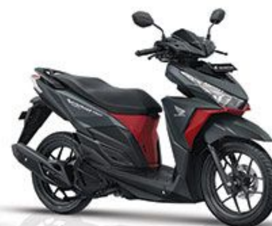
Exclusive Matte Black