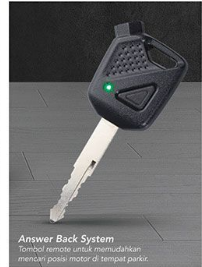
Answer Back System Tombol remote untuk memudahkan mencari posisi motor di tempat parkir.