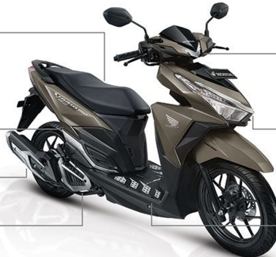
Radiator Garnish Tampilan lebih futuristik.