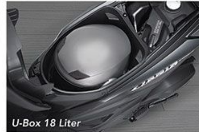
U-Box 18 Liter