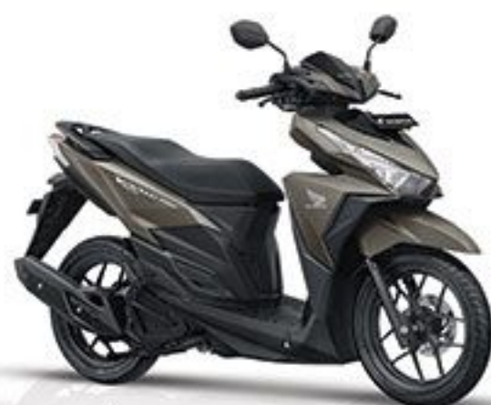
Exclusive Matte Brown