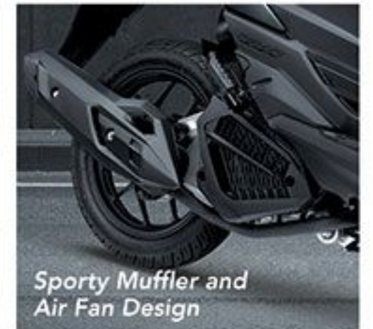
Sporty Muffler and Air Fan Design