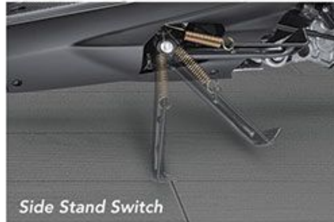
Side Stand Switch